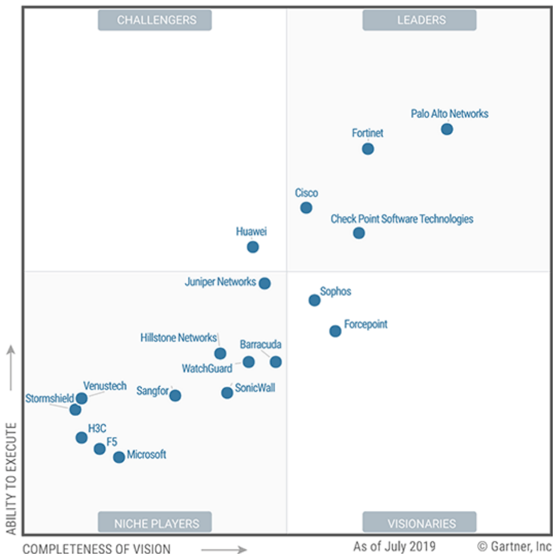
Figure 1. Magic Quadrant for Network Firewalls

A solução de segurança do Cepel é baseada em produtos da Fortinet que atendem as Unidades Ilha do Fundão e Adrianópolis. A aquisição dos pontos de acesso para atualização dos pontos de acesso que durante a pandemia deixaram de funcionar por obsolescência, bem como o seu controlador, garante ao Cepel a melhor relação de custo benefício, já que não obrigará a aquisição de novo controlador mantendo a homogeneidade com os pontos de acesso ainda em operação nas duas unidades. O fabricante Fortinet está no quadrante dos líderes em soluções de UTM.