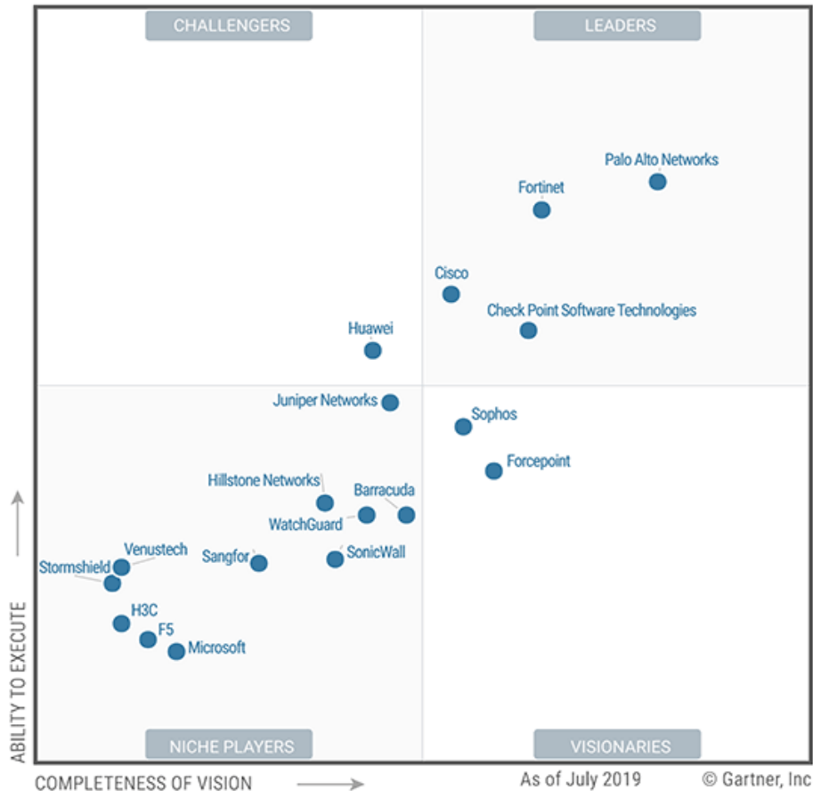
Figure 1. Magic Quadrant for Network Firewalls