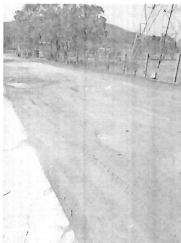
Figura 1: Estado atual do caminho que oferece acesso dos Blocos P ao U.